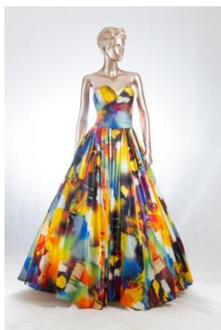
ウエディングドレスの 製造及びレンタル・販売