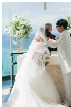
ウエディング プロデュース