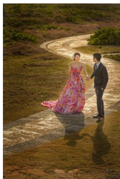
ブライダル ロケーションフォト