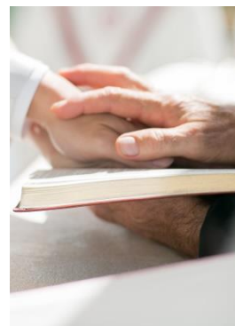
リーガルウエディング (婚姻証明)